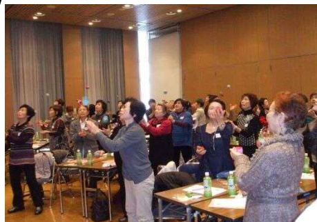
子どもに戻ってお手玉遊び

・いろいろなお仕事の内容がわかり良かったです。 ・初めての方とお話できて良かったです。 ・隣の方とお話ができ親くなれました。 ・家にこもらずどんどん外に出ようと思いました。 ・皆さまの楽しい様子を見て、私も頑張らなあと思いました。 ・お手玉遊びが楽しかったです。