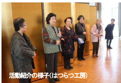
活動紹介の様子(はつらつ工房)

仕事はいつも1人で行うので、他の誰ともお会いするチャンスがなく、孤独な気持ちでしたが、私の他にも沢山女性がおられて心強く思いました。いろいろな能力をお持ちの方がたくさんおられるので、私も頑張ろうと思いました。新しいこと搜します！