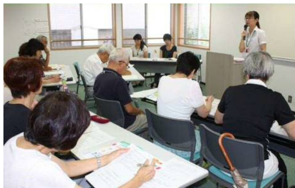
介護保険講習会。講師は市の介護保険課広瀬係長