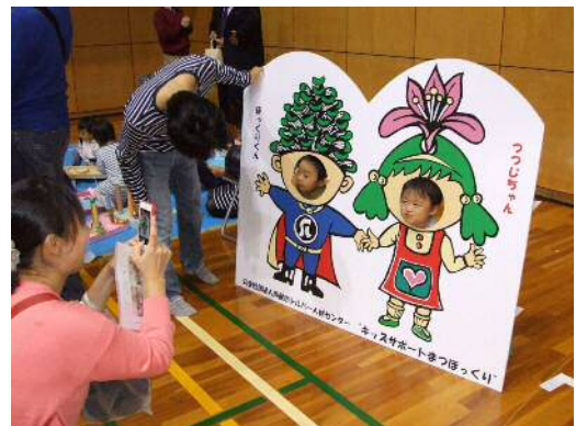
芦屋市シルバーの公認キャラクター「ぼっくりくんとつつちゃん」顔出しパネル