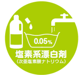
塩素系漂白剤 (次亜塩素酸ナトリウム)