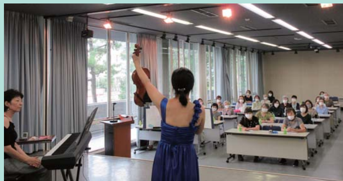
バイオリンのミニ知識をクイズ形式で、答の選択は挙手。

今回は会員だけでなく、一般の方の参加もあり、シルバー人材センターではこのような楽しい催しもあることをアピールできたのではないかと思います。