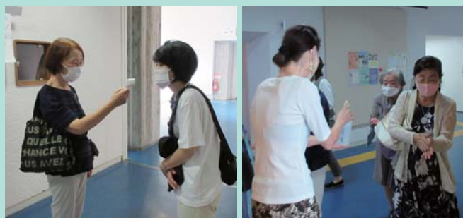
体温測定、アルコール手指消毒…入口での予防対策！