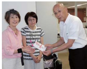
芦屋市社会福祉協議会へ持参