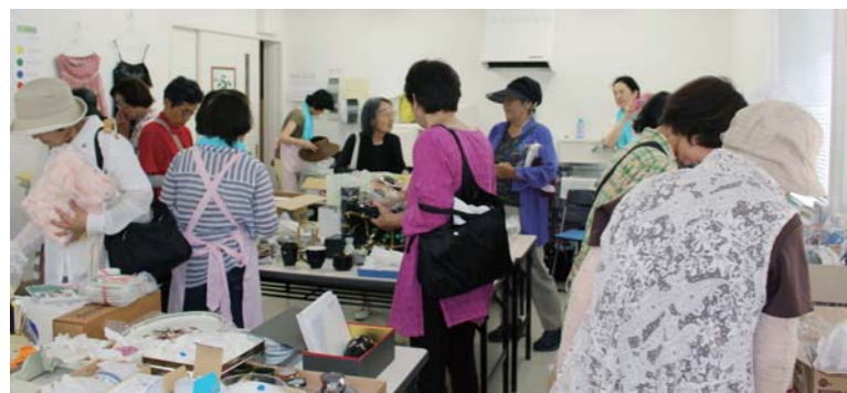
1階作業室と西側駐車場が品物でいっぱい